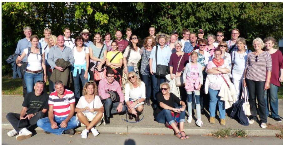
Gruppenfoto vom Tagesausflug nach Kandern anlässlich des 20jährigen Jubiläums des KLM Basel